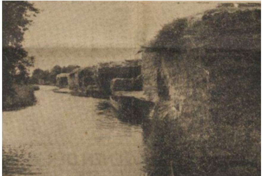
Rietbulten langs de Hoge Weg: de rijkdom van deze plassenwereld.

Zo, daar heeft U een allegaartje over een wereldje, onbekend aan de meeste Nederlanders. Misschien leest U het en denkt er nooit meer aan terug, maar misschien ook - mocht U eens in de buurt komen en over de rietwereld staren - denkt u: kijk, daar leven en werken nu vele mensen, onzichtbaar en onmerkbaar, zij kennen geen autobussen en verkeersborden. Maar meer dan het leven van ons, is hun leven verbonden met de opgang en ondergang der zon, met het wisselen der seizoenen en met het drijven van de wolken boven het riet. Hun riet.