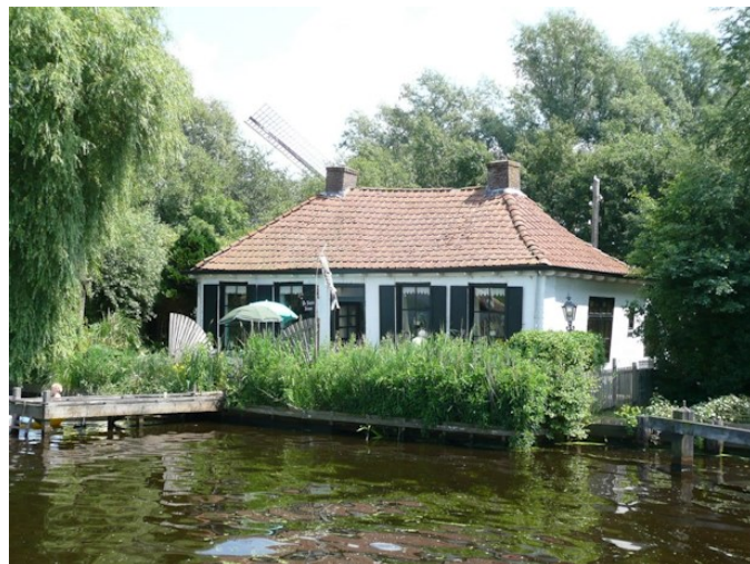
"De Laatste Stuiver" in oude glorie