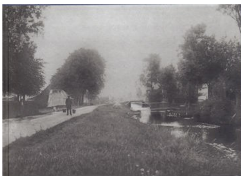
NIJETRIJNE Terugblik op een turbulente eeuw