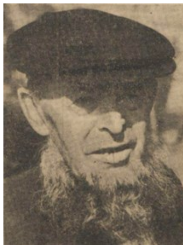
De Ruiter van Ossenzijl, ondanks zijn 86 jaar en een leven van hard werken nog een hechte oude man.

Een dorp, dat lang heeft geslapen zonder groei of verandering, maar dat nu begint te ontwaken en zich uit te strekken. Dat jarenlang enkel leefde op wat het water en de rietlanden oprachten en wat de schippers kochten op hun haastige doortochten, maar dat zich nu aarzelend begint op te richten, het oog gevestigd op de Noord-Oostpolder.