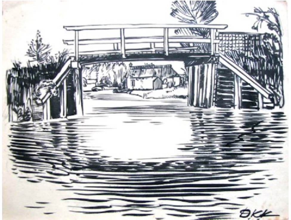
Een prachtig sfeerportret van de Scheene